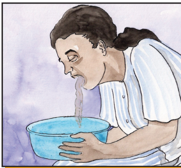
Si presenta vómitos o diarreas graves

Si le cuesta trabajo despertar; si tiene confusión (como el no reconocimiento de familiares o amigos)