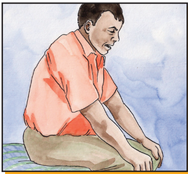
Dificultad para respirar

ACUDA AL CENTRO DE SALUD EN CASO DE PRESENTAR SINTOMAS GRAVES COMO: