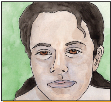
Si los labios o la piel se le ponen de color azul